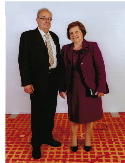
Fundadores da empresa

Trabalhamos e fabricamos produtos em alumínio, mas a evolução do mercado começou a pedir alternativas e apostámos, desde 2012, no PVC. Sentimos que o cliente procurava outros materiais para substituir as caixilharias de ferro, alumínio e madeira antigos. Como o PVC é um produto de elevada qualidade e durabilidade decidimos que seria uma boa aposta. A Caixistrela fabrica caixilharia de alumínio desde a barra de 6,5 metros e transforma-a em qualquer tipo de caixilho. O PVC vem transformado no produto final – que encomendamos ao nosso fornecedor – e apenas efetuamos a respetiva colocação no local.